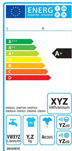
Abbildung 2: Blanko-Label für Waschmaschinen

Das wesentliche Element der Label ist die Energieeffizienzklasse des Produkts. Grundsätzlich gibt es sieben Energieeffizienzklassen : von A (sehr effizient) bis G (wenig effizient), die zudem mit einer Farbskala von dunkelgrün bis tiefrot unterlegt sind. Bei entsprechendem technischen Fortschritt konnten außerdem (bislang) die Klassen A+, A++, A+++ angefügt werden. Zusätzliche Piktogramme auf dem Label geben Auskunft über den jährlichen Energieverbrauch und weitere produktspezifische Informationen (bei Waschmaschinen z. B. den Wasserverbrauch oder die Schleuderwirkung).